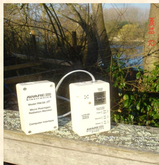
Jesús Castellanos avril 2011